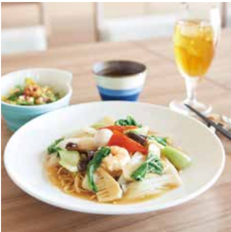
▲麺飯 LUNCH 1,600円