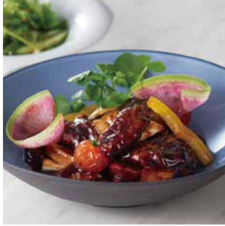
▲三元豚の彩菜黒酢豚 1,800円