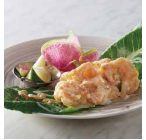
▲大海老のオーロラソース ライムと一緒に 2,000円