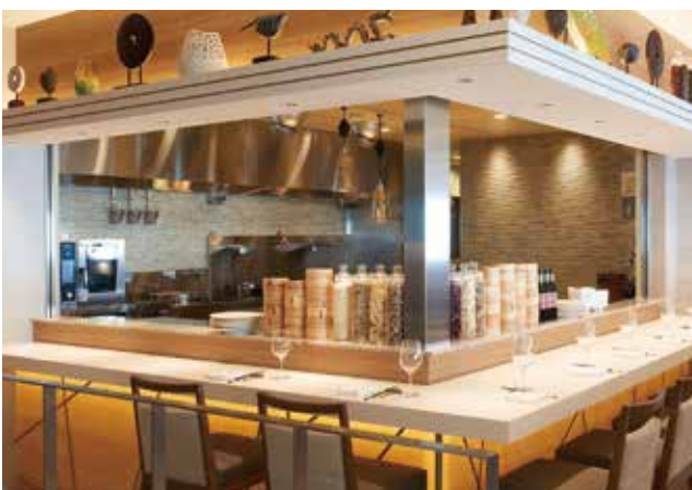
▲カウンター席&キッチン