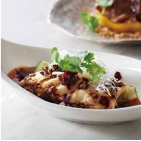
▲よだれ鶏 ～8年熟成黒酢風味～ 1,400円