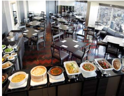
ランチバイキング